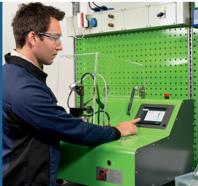
Jednoduché ovládání pomocí dotykového displeje a to i bez předchozích zkušeností v oblasti testování vstřikovačů vznětových motorů

Podíl systémů Common Rail v oblasti vznětových motorů se neustále zvyšuje.