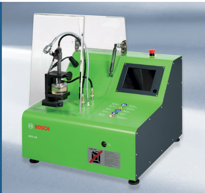
EPS 118: Prostorově úsporný a robustní stolní přístroj s průhlednou komorou